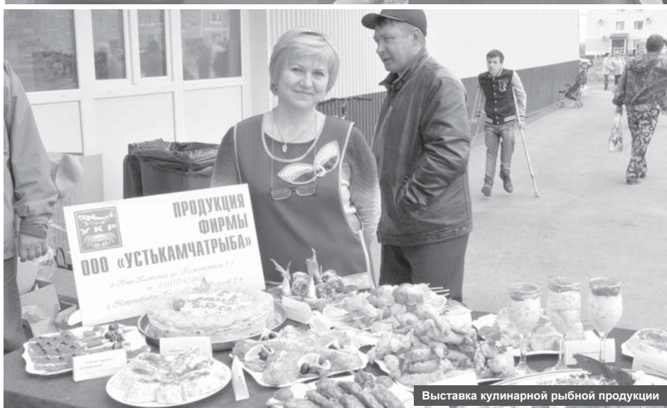
Выставка кулинарной рыбной продукции