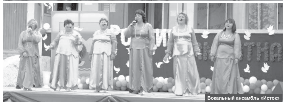
Вокальный ансамбль «Исток»

Праздничные мероприятия открыли спортивными соревнованиями для маленьких поселчан на стадионе ДЮСШ. Первым этапом стал бег на дистанции 30 и 60 метров. На втором этапе юные спортсмены метали мяч в длину. Последним же испытанием стали прыжки в длину. Ребята выступили с воодушевлением и немалым азартом. По итогам спортивного праздника участники получили медали и подарки.