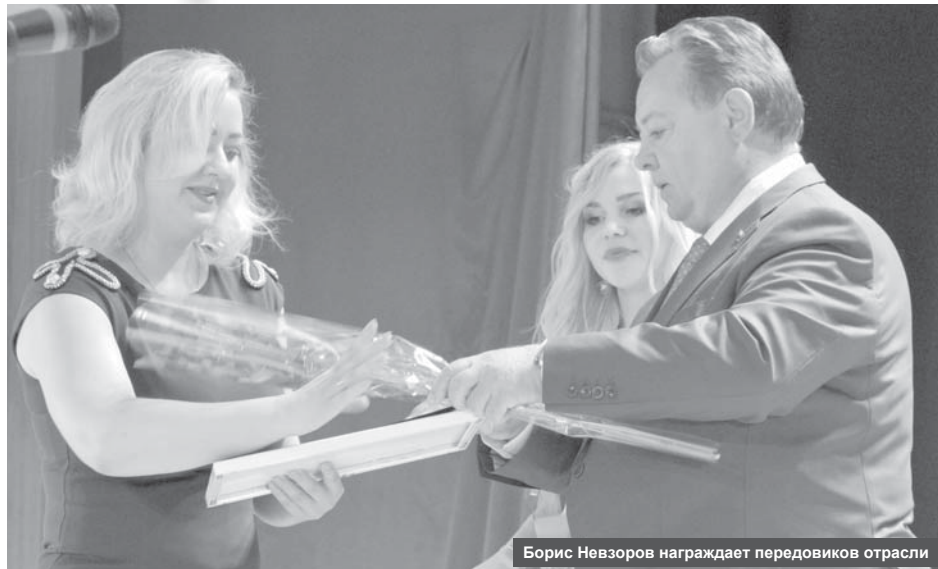
Борис Невзоров награждает передовиков отрасли