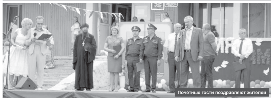
Почётные гости поздравляют жителей

8 июля в Ключах отмечали 276-ую годовщину со дня образования посёлка, День семьи, любви и верности, а также День рыбака.